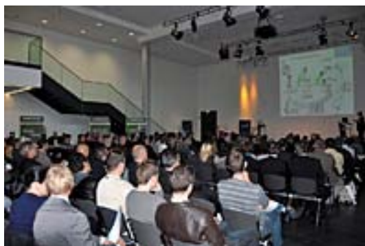
Abb. 1: Ausgebucht bis auf den letzten Platz: Der Kongress im Herbst 2010.

Die Teilnahmegebühr inklusive Bewirtung beträgt pro Person 249,- Euro zzgl. MwSt. Die Anmeldung zum Kongress ist online unter www.ddn-online.net/kongress.php möglich.